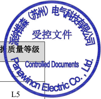
表 4-3 活动数据不确定性评估